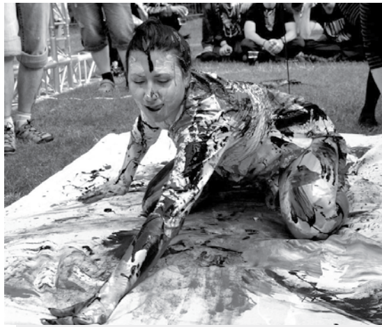
Performanse „Manokūnas–tavodrobė“ mergina buvo ištepta dažais nuo galvos iki kojų. Beje, vyravo kraujo ir juoda spalvos.

Anykščių rajono gyventojams bilietai į festivalį kainuoja 25 EUR. Bilietai su nuolaidomis įsigyjami tik festivalio dienomis prie įėjimo. Norint įsigyti bilietus su nuolaida, būtina turėti atitinkamus dokumentus: asmens dokumentą, moksleivio, neįgaliojo pažymėjimą, gyvenamosios vietos deklaraciją.