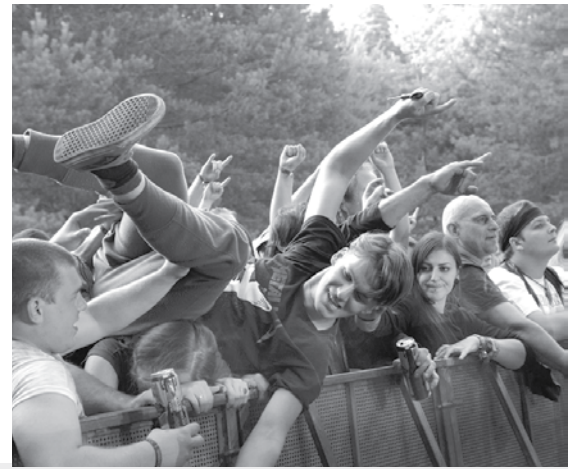
Vokiečiai „Dust bolt“ kaip reikiant įkaitino publiką.